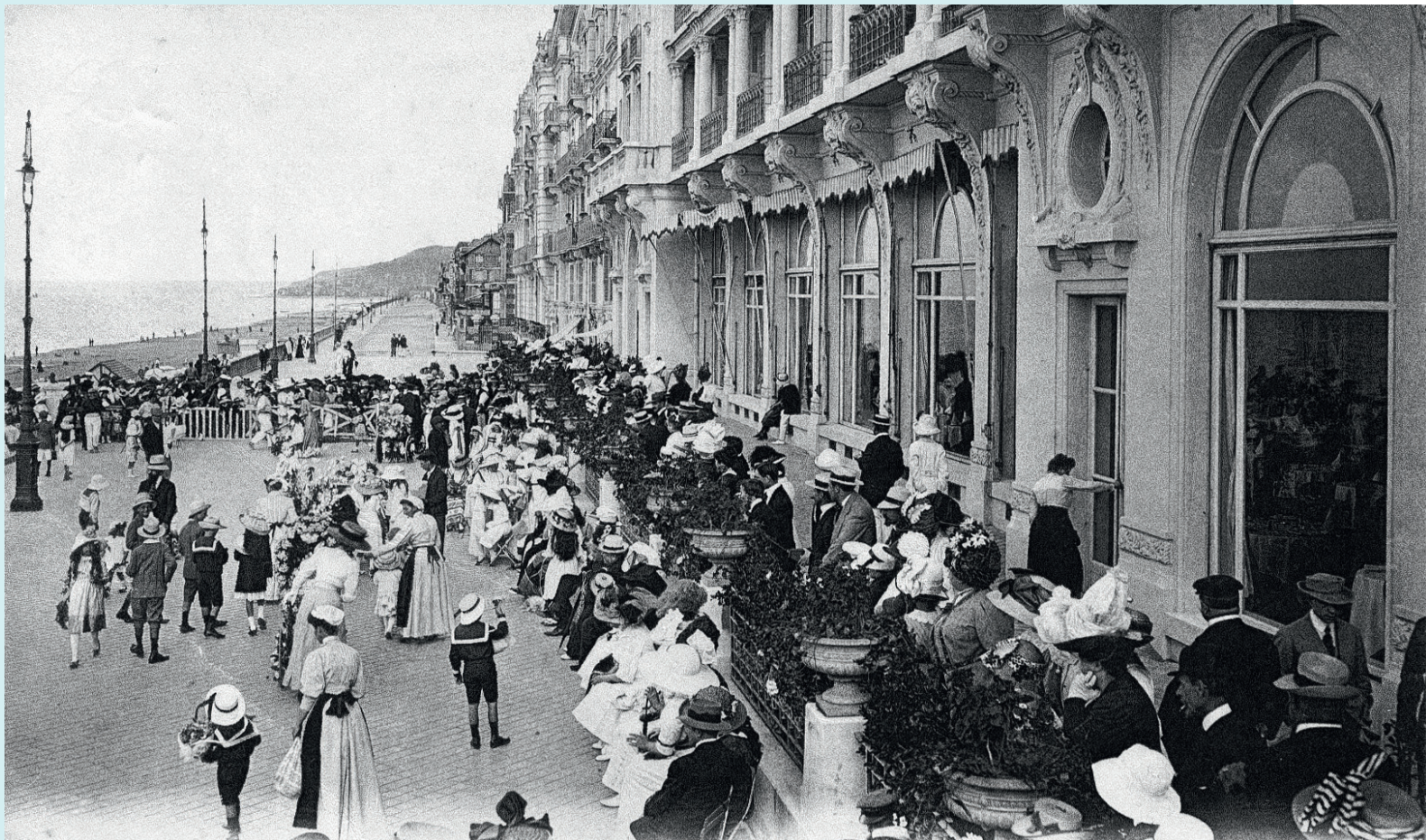
La terrasse du Grand Hôtel à Cabourg un jour de fête d'enfants